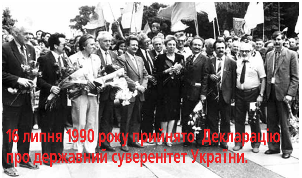
16 липня 1990 року прийнято Декларацію про державний суверенітет України.

№ 05 – 06 (261 – 262) 2017 E-mail: chaspress@ukr.net