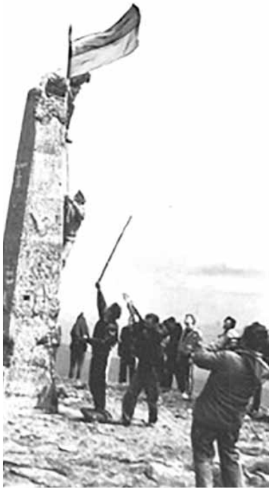
Уперше молоді українці, члени Народного Руху України за перебудову піднялися на Говерлу із забороненим у радянській імперії синьо-жовтим стягом 16 липня 1990 року.

У кожного народу є свої святині. Або, як кажуть, всяка нація повинна мати свою "Мекку", куди бодай раз у житті кожен громадянин повинен прийти й відчути себе частиною цієї святині. Для українців цим символом паломництва стала найвища вершина українських Карпат - гора Говерла.